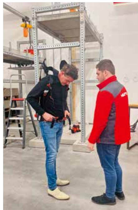
Hilti blijkt al ver met de doorontwikkeling van een exoskelet voor afbouwers.