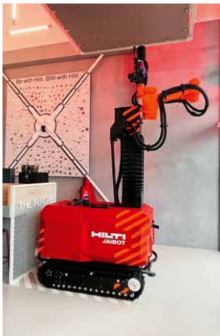
De Jaibot, een semi-automatische boorrobot, die bijdraagt aan een hogere productiviteit, planbare output, betere kwaliteit en een gezondere werkomgeving.