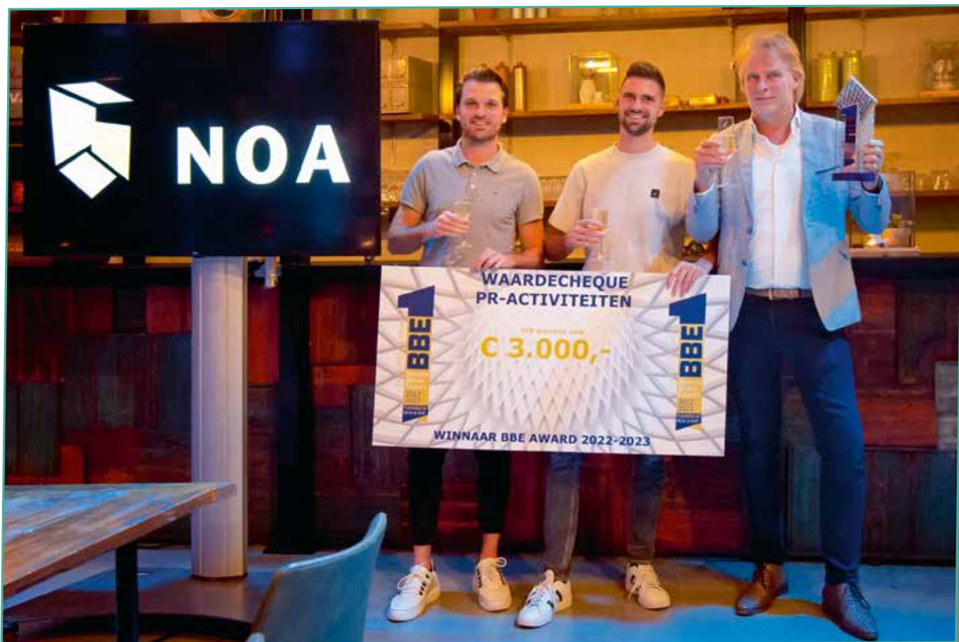
BBE-Award winnaar Jaleco Totaal Projectafbouw B.V.

Op www.binnenbouwexpert.nl zijn de bedrijfsvideo's van de genomineerden en natuurlijk de winnaar te bekijken.